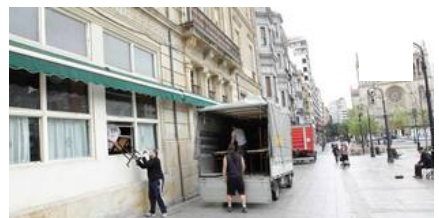
Vaciado del Café Dindurra, en Gijón